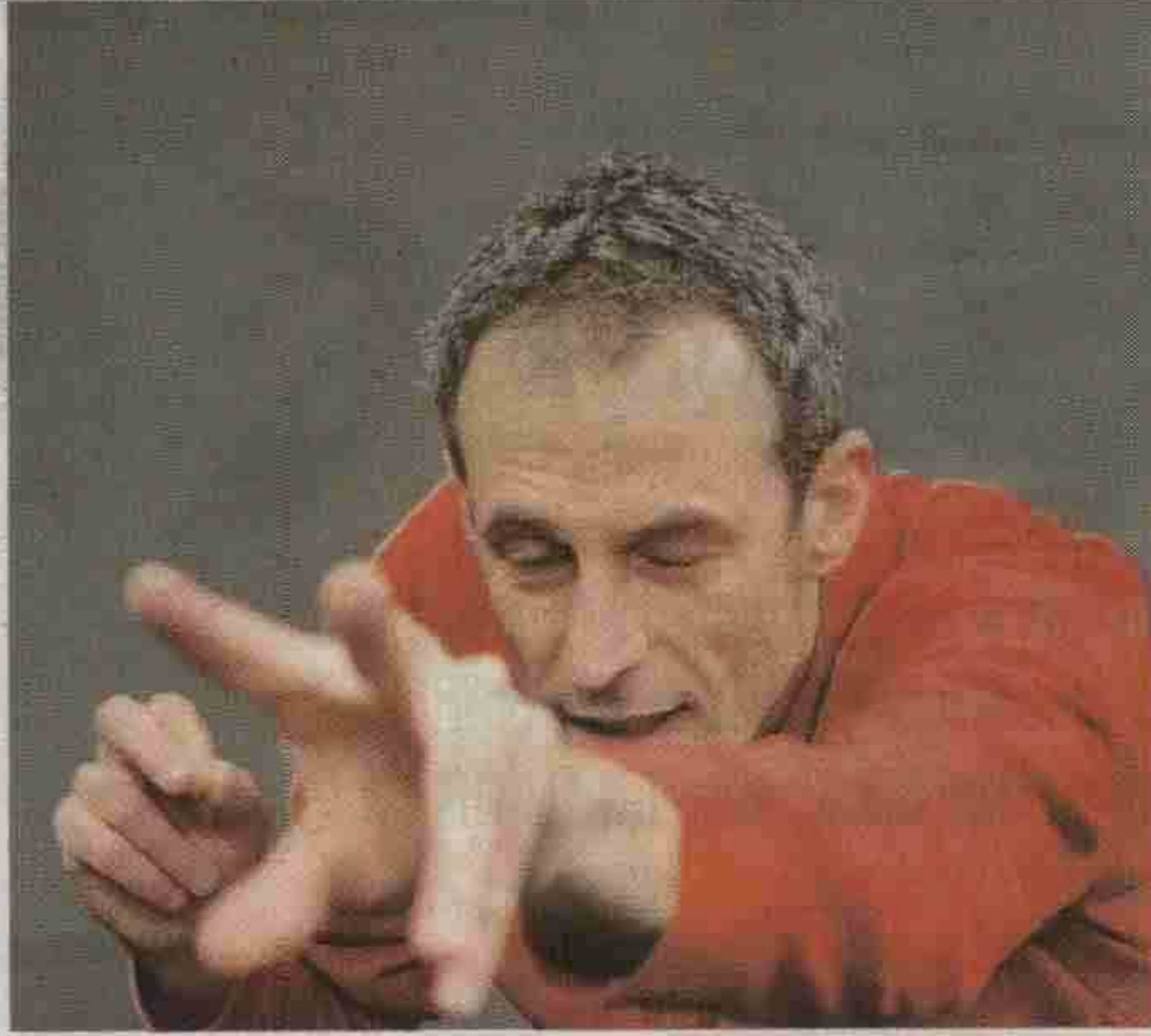
Xavier Le Roy - Le Sacre du Printemps