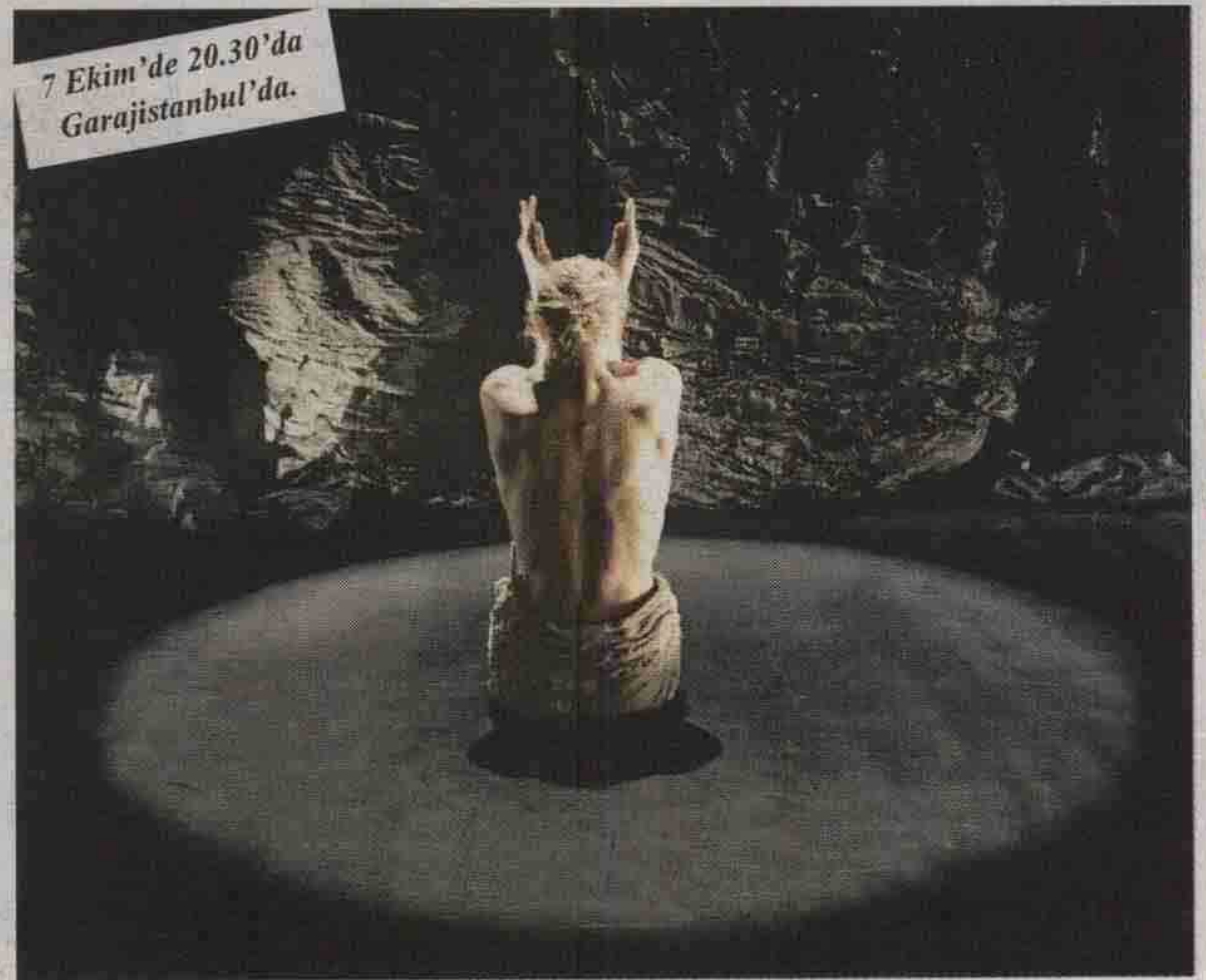
7 Ekim'de 20.30'da Garajistanbul'da.

18-19 Ekim'de 20.30'da MSGÜ Bomonti Kampüsü Şebnem Selçuk Aksan Sahnesi'nde.