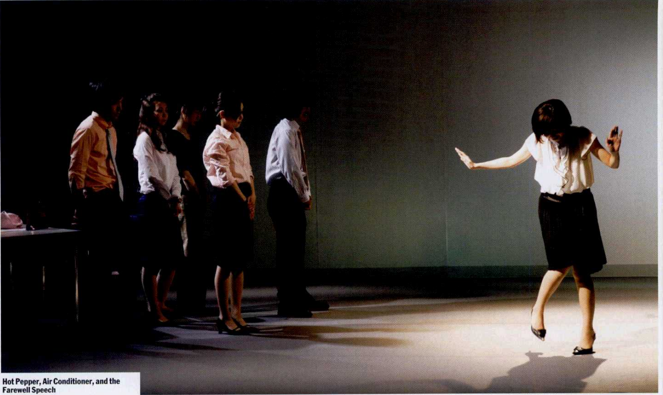
Hot Pepper, Air Conditioner, and the Farewell Speech