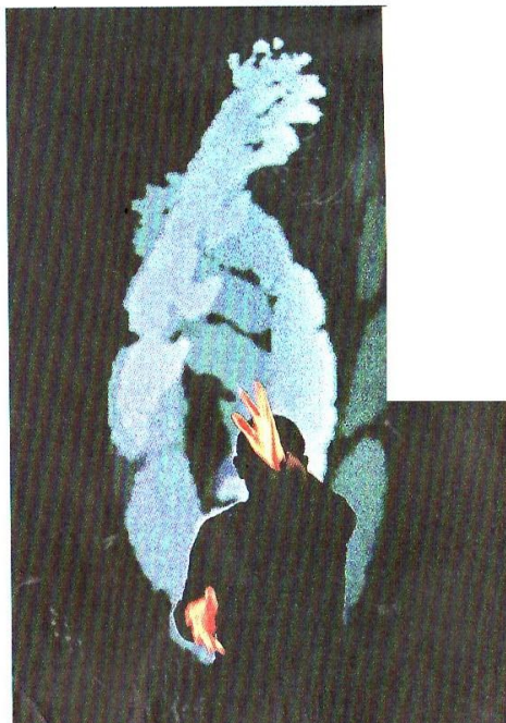
LIGHT MUSIC : une grandiose réussite qu'on s'arrache en France et qui s'apprête à voyager de Londres à Pékin.

Festival Danse Balsa Marni & Raffinerie, jusqu'au 24 juin, à Bruxelles. Tél. : 02.735.64.68. Net : www.balsamine.be . Urban bubbles sera repris ce 20 juin au Kaaitheater, à Bruxelles, accompagné au piano par Alexander Lonquich. Tél. : 02.201.59.59.