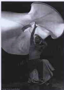
Modern zamanlar dervişi Ziya Azazi, modern zamanlar dervişi olarak kendini tanımlıyor. Geleneksel dervişlikten farklı olarak, modern zamanlar dervişi, modern zamanlar dervişi olarak kendini tanımlıyor.

Modern zamanlar dervişi, modern zamanlar dervişi olarak kendini tanımlıyor. Geleneksel dervişlikten farklı olarak, modern zamanlar dervişi, modern zamanlar dervişi olarak kendini tanımlıyor.